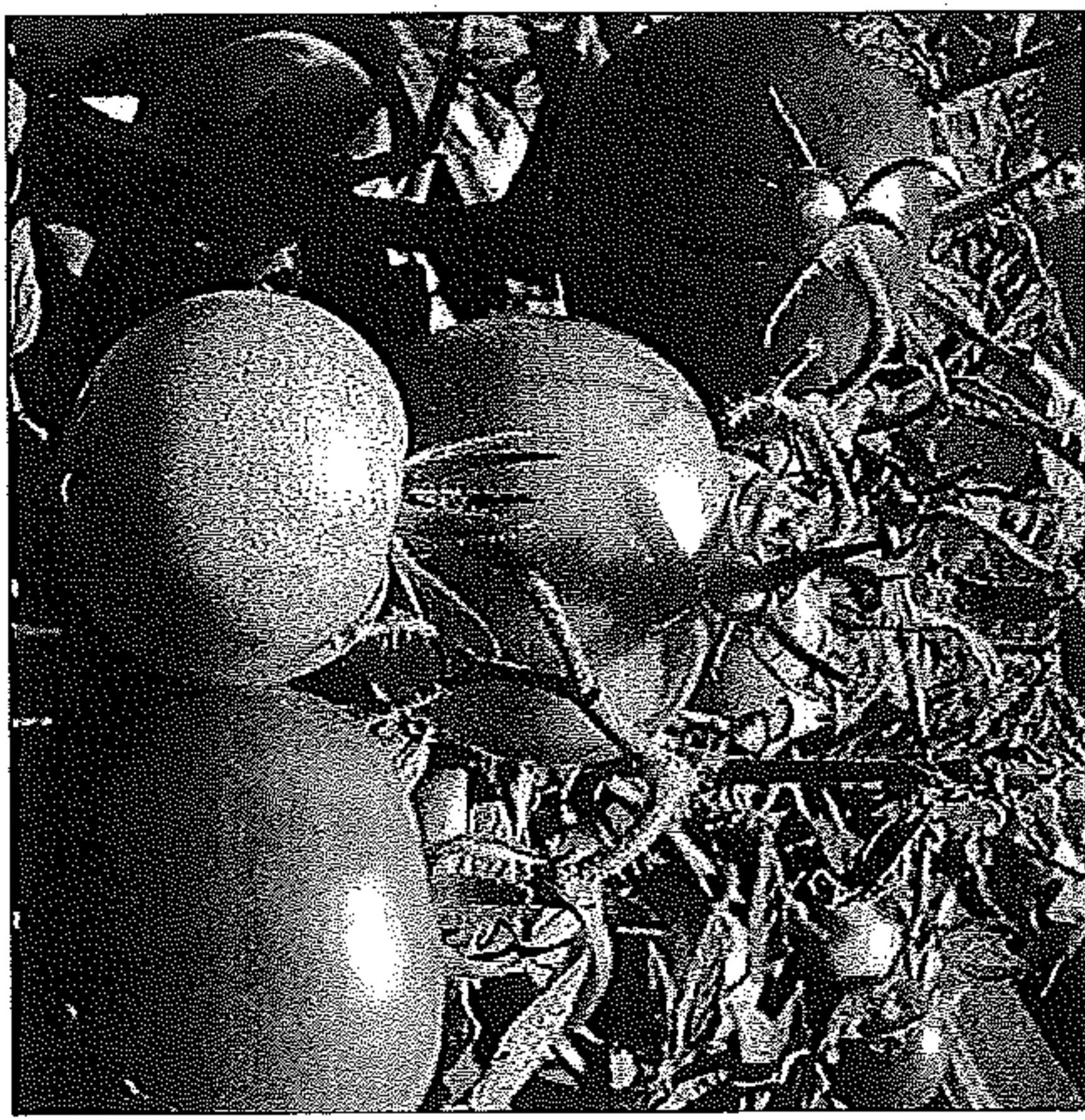
Prodotti locali Ogni mercoledì in piazza Giotto, direttamente dal produttore

zo ha invece sottolineato che fatto 100 il prezzo di un prodotto, solo il 17% va al produttore. "Mi auguro - ha detto - che questa evidenzissima stortura possa essere eliminata o almeno ridotta proprio grazie al mercato di Coldiretti". I produttori che venderanno direttamente i loro merci si alterneranno ogni settimana per garantire il massimo di partecipazione. "Al mercato di Campagna amica" si potranno acquistare frutta, ovviamente di stagione, ortaggi, miele, olio, vino, marmellate, salumi, formaggi e tanto altro ancora - ha ricordato il direttore di Coldiretti Claudio Massaro - E ci